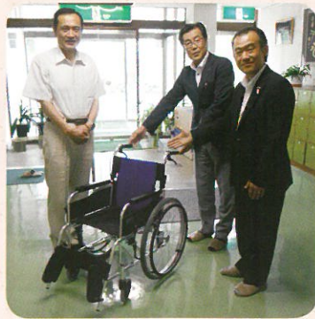
山形パナソニック様より寄贈