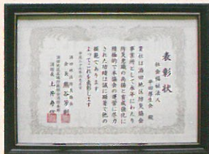
酒田地区防災協会より 表彰状授与(6/5)